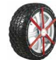
Easy Grip chaînes à neige composite

La conduite sûre étant la plus haute priorité, en particulier dans des conditions hivernales extrêmement difficiles, Michelin a conçu une gamme complète d'accessoires hiver utilisables dans toutes les conditions pour compléter les pneus hiver MICHELIN.