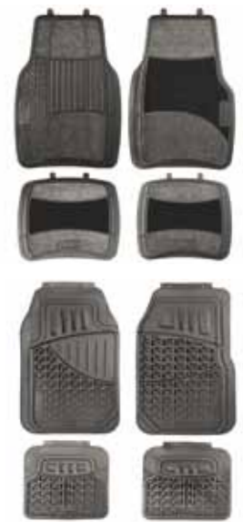
Tapis de sol