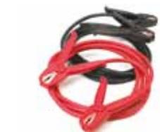
Câbles de démarrage