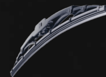
Balais d'essuie glaces traditionnel

Conduire par un temps humide ou hivernal peut augmenter le risque de danger pour l'automobiliste. L'engagement ferme de Michelin a toujours été d'améliorer la sécurité du conducteur et les balais d'essuie-glace MICHELIN renforcent cet engagement.