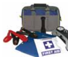
Kits de dépannage d'urgence