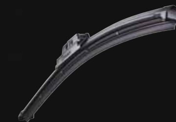
Balais d'essuie glaces plats