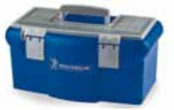
Armoire à outils