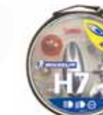
Kits sécurité éclairage