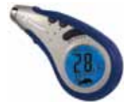
Contrôleur de pression programmable