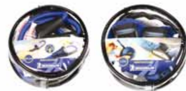
Sangles et sandows