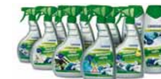
Produit de soin et d'entretien écologique