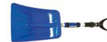
Pelle à neige