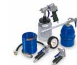
Outils de gonflage