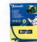
Gilet de sécurité