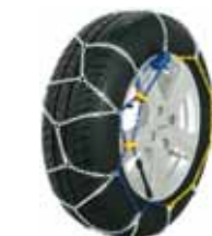
Chaînes à neige métalliques