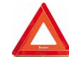
Triangle de signalisation