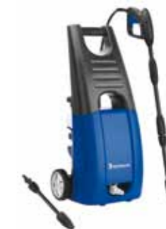
Nettoyeur haute pression

Cette gamme de produits d'entretien auto aide les automobilistes à garder l'aspect neuf de leur véhicule pour garantir un état impeccable, à l'intérieur comme à l'extérieur. Grâce à la gamme d'entretien auto écologique, ils peuvent le faire sans porter atteinte à l'environnement.