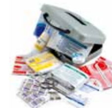
Trousse de premier secours