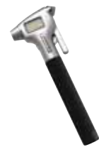
Indicateur de pression avec marteau d'évasion

<< Cette gamme innovante d'indicateurs de pression, de pompes à pied, de gonfleurs et de compresseurs d'air offre une performance fiable et est facile d'emploi. >>