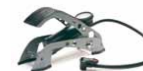
Pompes à pied