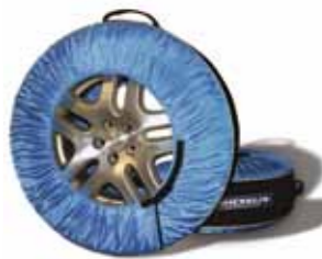
Housse pour roue/pneu